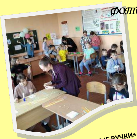
МАСТЕР-КЛАСС «УМЕЛЫЕ РУЧКИ»