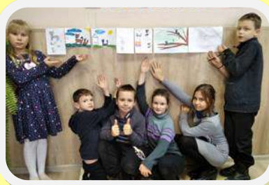
Конкурс рисунков «Кошачий переполох»