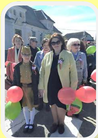
НА МИТИНГЕ В ДЕНЬ ПОБЕДЫ