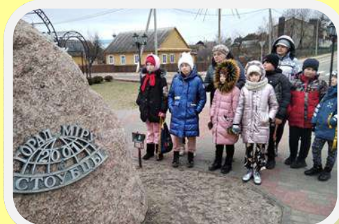
СУББОТНЯЯ ЭКСКУРСИЯ ПО СТОЛЪЦАМ