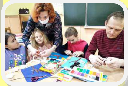
ЗАНЯТИЕ «УСПОКОИТЬ ВУЛКАН»